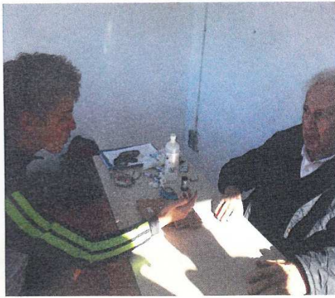
El Dr. Segura observando los primeros resultados del análisis de sangre.